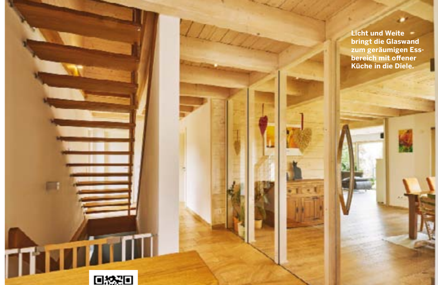
Licht und Weite bringt die Glaswand zum geräumigen Essbereich mit offener Küche in die Diele.

Die Südseite mit großzügig verglastem Wohn- und Essbereich sowie der glasdachgeschützten Terrasse.