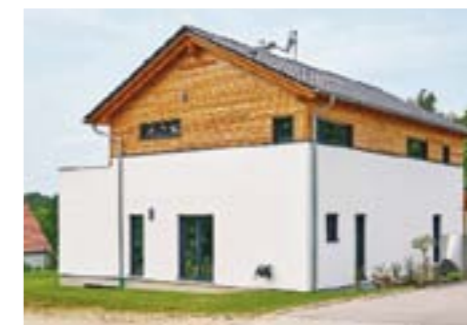
Der herausgezogene Wohnbereich, der hohe Kniestock und der knappe Dachüberstand weichen un-aufgeregt von der Bautradition ab.

Die Deckenbalken sind konstruktiver Bestandteil und kein Deko-Effekt