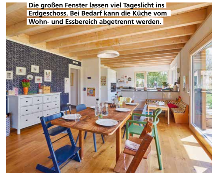
Die großen Fenster lassen viel Tageslicht ins Erdgeschoss. Bei Bedarf kann die Küche vom Wohn- und Essbereich abgetrennt werden.

Im Obergeschoss haben die Kinder ihren eigenen Trakt mit Bad zur Verfügung. Die Eltern freuen sich über eine Ankleide und ein barrierefreies Bad. In sämtlichen Räumen hier oben ist die Decke offen bis zum First. Die obere Diele wird über ein Dachflächenfenster belichtet, die geradläufige Treppe durch eine in die Wand integrierte Stufenbeleuchtung aufgewertet. Bad- und Küchenmöbel, Sitzbänke und Schränke stammen aus der herstellereigenen Möbelmanufaktur.