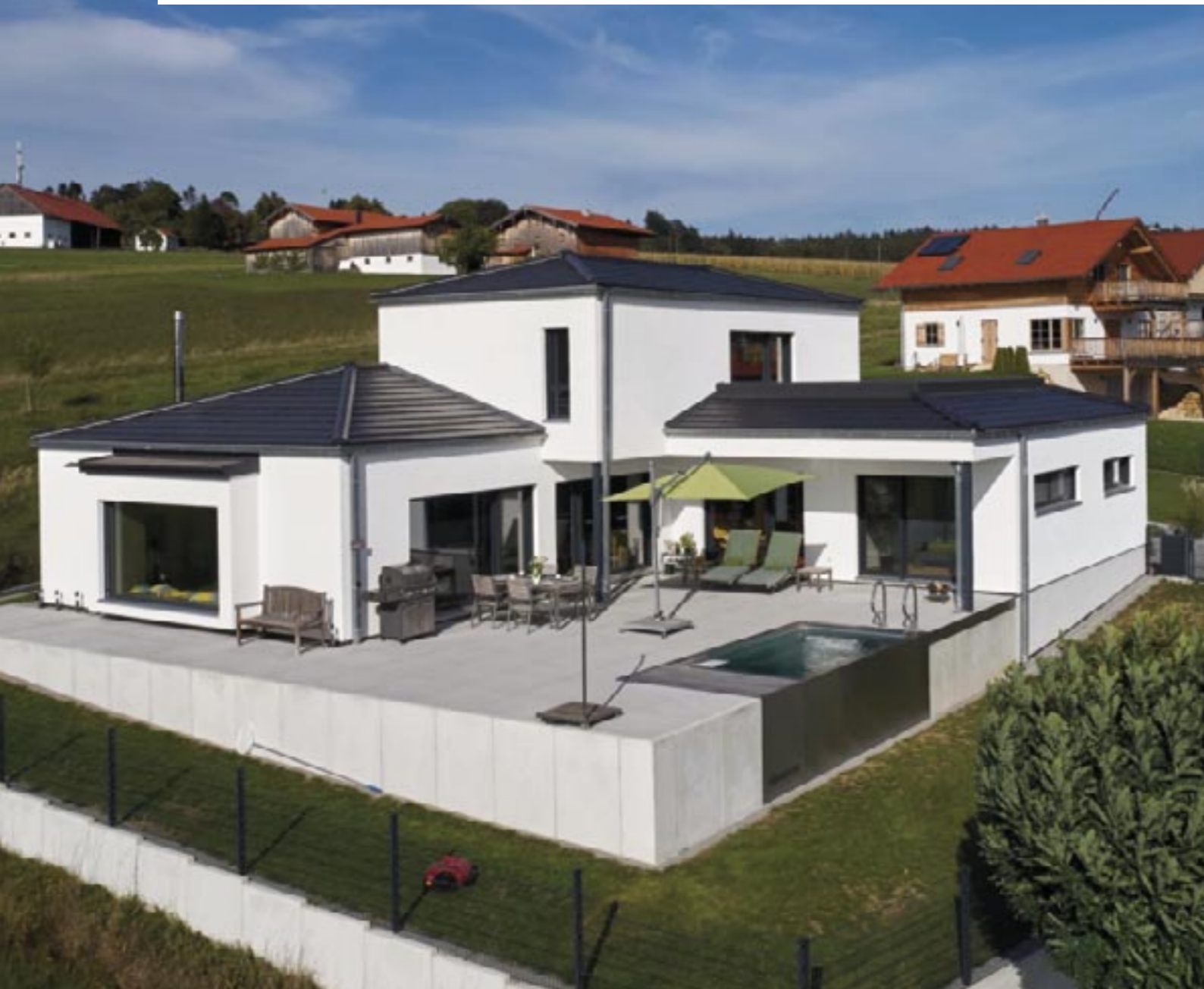
Auf ein quadratisches Podest gestellt: ein Haus mit Blickfangqualitäten. Nicht nur die ungewöhnliche Gliederung des Baukörpers trägt dazu bei. Auch die Dachform und die integrierte Terrasse im ersten Stock ziehen faszinierte Blicke auf sich.

Wohnen, Essen, Kochen, Schlafen – all das befindet sich in einer Ebene. Dennoch gibt es ein Obergeschoss. Und dieses birgt für die Bewohner einen attraktiven Zusatznutzen