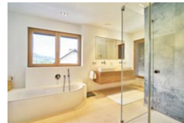
Schon der Grundriss zeigt, dass in diesem Bad mit Wanne und Dusche noch Platz für eine Sauna ist.