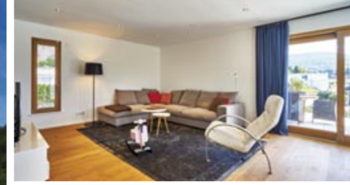
Großzügige Fensterfronten eröffnen sowohl dem Wohnraum (links) als auch dem Essbereich einen unverstellten Blick ins Tal – dank der Lage des Küchenblocks sogar beim Kochen.

Der Wohnbereich erstreckt sich über zwei Etagen und verfügt über 186 Quadratmeter. Mit anderen Worten: Großzügigkeit ist ein Teil des Planungskonzepts. Den Mittelpunkt bildet der üppige Essbereich mit offe-