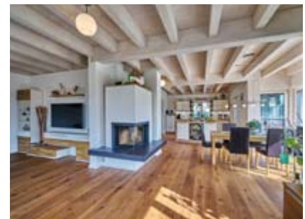
Sehr gemütlich präsentiert sich das Innere des Hauses. An kühlen Tagen lockt der Kaminofen mit seiner angenehmen Wärme.

Konzipiert wurde das Haus für eine vierköpfige Familie, die sich über ein großzügiges Platzangebot im Innern freuen darf. Links und rechts wird die Diele von einem Büro bzw. Gästezimmer, einem Technikraum und einem Gästebad flankiert. Geradeaus mündet sie in den offenen Wohn-, Ess- und Kochbereich, der von bodentiefen Fenstern mit Tageslicht geflutet wird. Durch die winkelförmige Anordnung werden die Funktionszonen leicht voneinander separiert. Zwischen Wohn- und Essbereich befindet sich ein eleganter Kaminofen mit Sitzgelegenheit, der die Bewohner an kalten Tagen mit seiner milden Wärme verwöhnt. Dank der geringen Neigung des Zeltdachs schränken im Obergeschoss keine Schrägen die Bewegungsfreiheit ein. Hier liegen die Individualräume der Familie bestehend aus zwei Kinderzimmern und dem Elternschlafraum mit Ankleide sowie dem Familienbad. Ergänzt wird das Raumangebot von einem Hauswirtschaftsraum. Beheizt wird das Haus über eine Gaszentralheizung, wobei eine Fußbodenheizung die