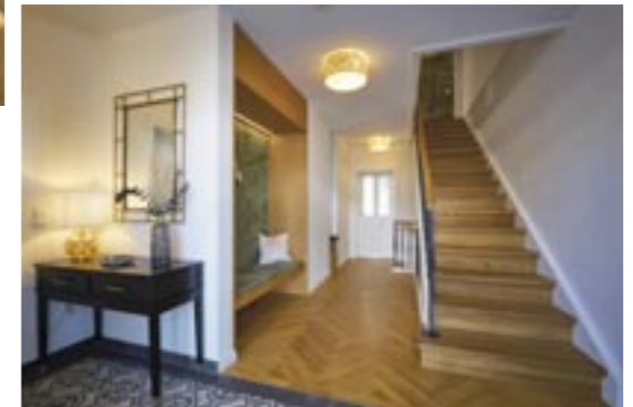
Die Diele empfängt mit Aufenthaltsqualität, edlem Fischgrät-Parkett und der eleganten geraden Eichentreppe.

Zu den Sonnleitner-Spezialitäten gehören auch passende Einbaumöbel aus der hauseigenen Möbelmanufaktur