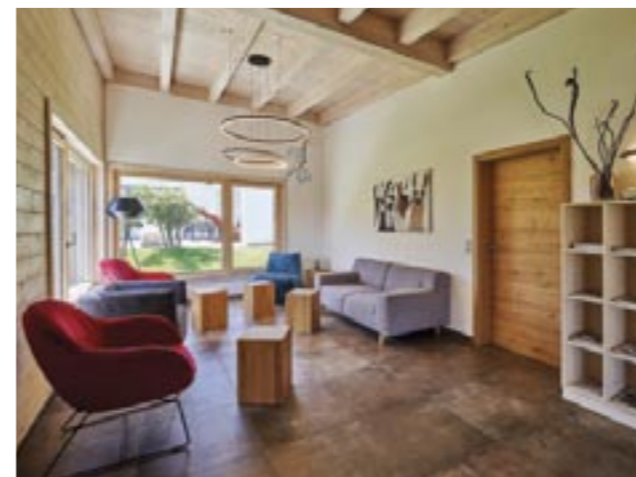
Individuell umgeplant, kann man hier auch wohnen.

zicht auf rechte Winkel. So zaubern sie recht ungewohnte Raumerlebnisse, die durch reizvolle Lichtspiele und stetig wechselnde Spiegelungen noch verstärkt werden.