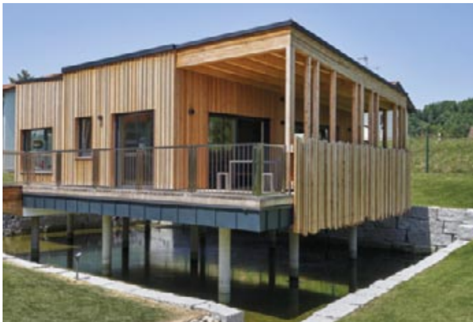
Einen Garten gibt es bei dieser Location nicht, aber eine geräumige Terrasse.

Ein Bungalow auf Pfählen | Den Prototyp dieses kompakten Holzhauses hat Hersteller Sonnleitner als Event-Location konzipiert. Aber ja: Das Modell gibt es natürlich auch mit Bad und Schlafzimmer.