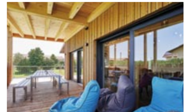
Die überdachte Terrasse macht das Wohnen draußen selbst bei Wind und Wetter zum Vergnügen.

Fotos, Grundriss: Sonnleitner Holzbauwerke GmbH