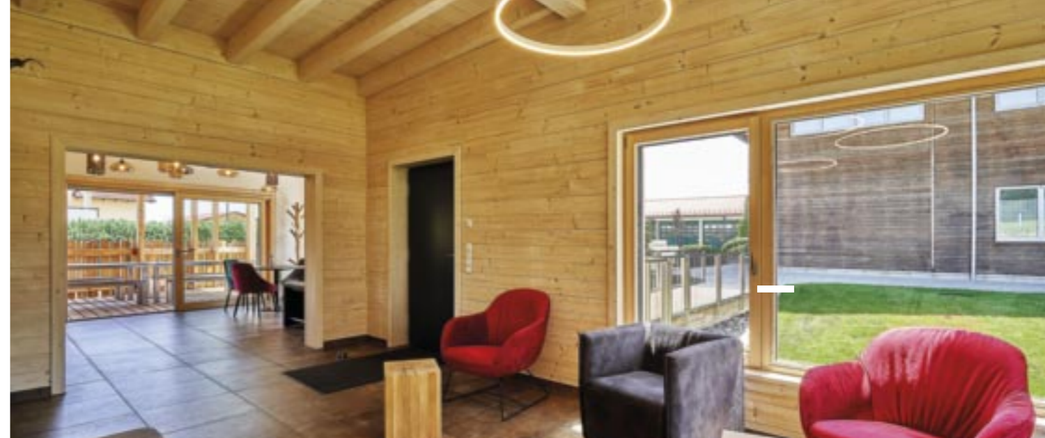
Holz außen, Holz innen: Behaglichkeit und gute Wärmedämmung.

Dass es auch anders geht, bewiesen die Architekten nicht nur mit der Pfahlbauweise, sondern auch mit ihrem weitgehenden Ver-