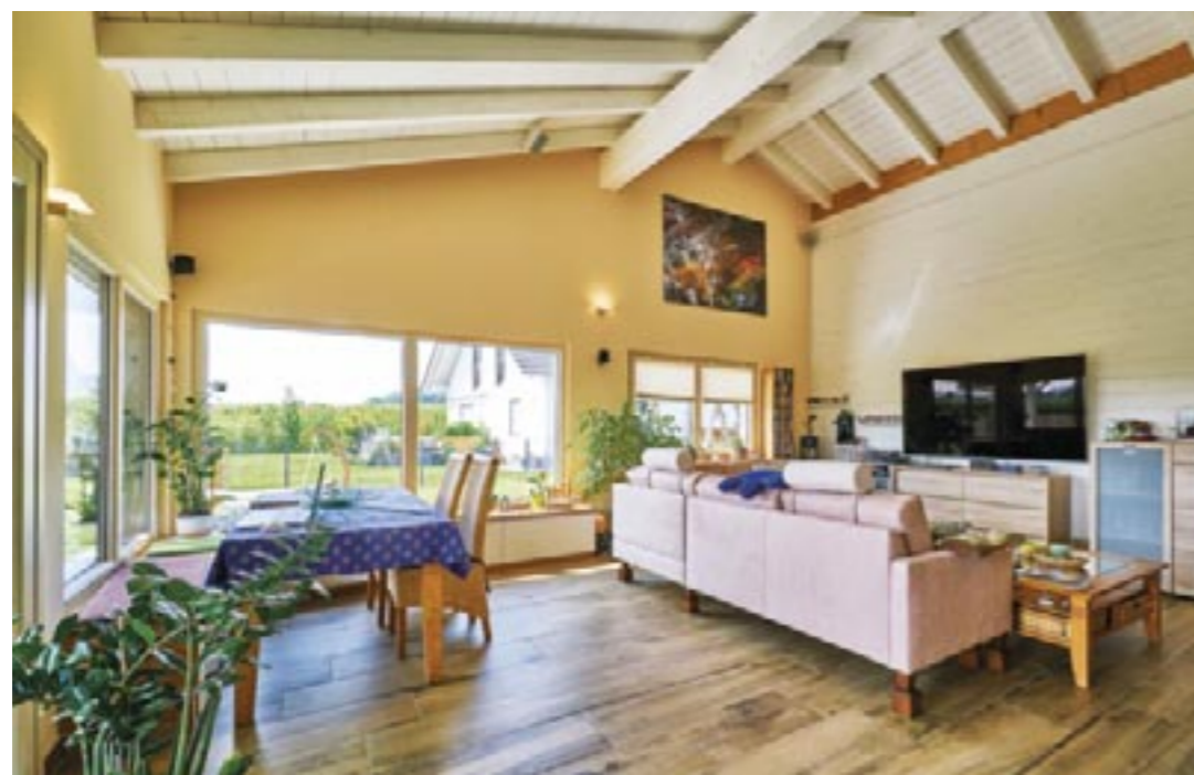
Der sichtbare und weiß lackierte Dachstuhl weitet den Wohn- und Essbereich optisch.