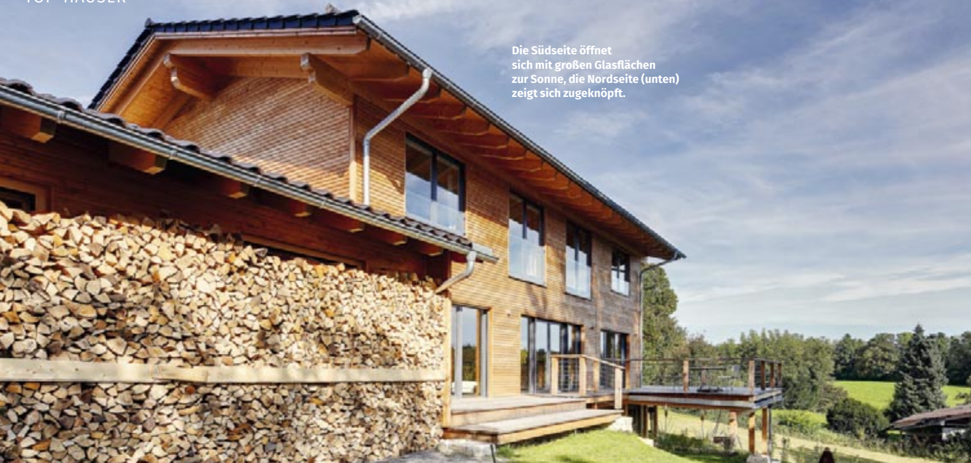
Die Südseite öffnet sich mit großen Glasflächen zur Sonne, die Nordseite (unten) zeigt sich zugeknöpft.