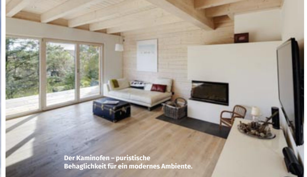
Der Kaminofen – puristische Behaglichkeit für ein modernes Ambiente.