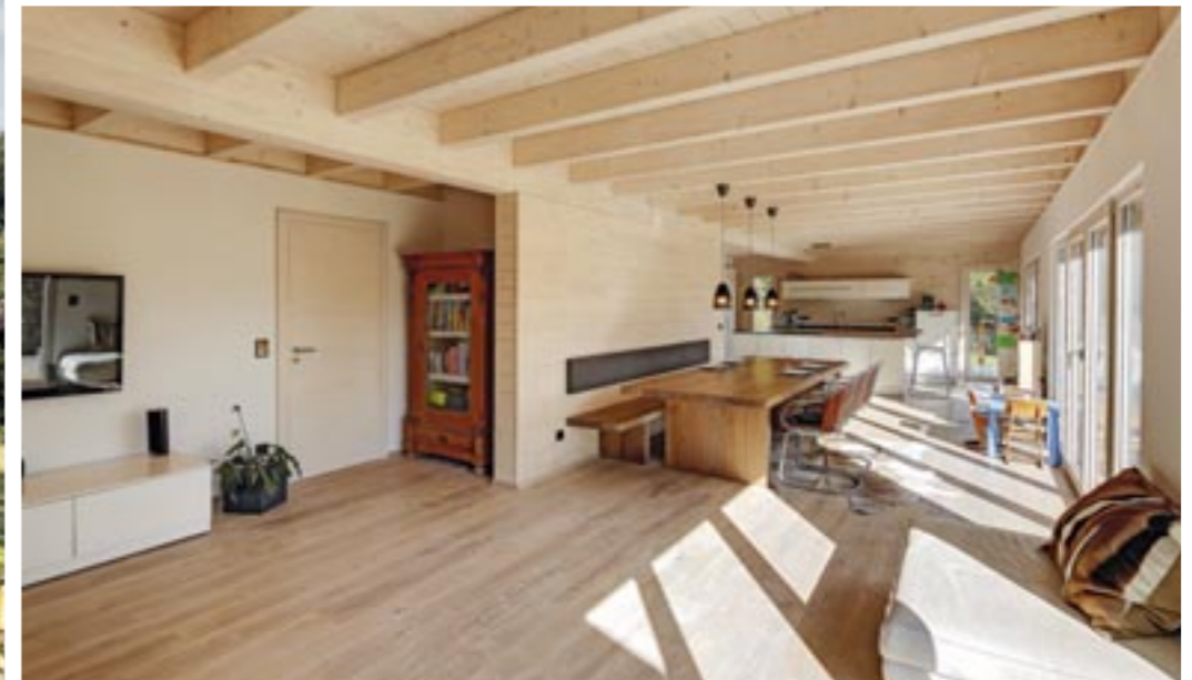
Der Wohnbereich mit offener Küche erstreckt sich über die gesamte Längsseite des Hauses, von bodentiefen Terrassenfenstern belichtet.

Ebenso symmetrisch wie die Fassade ist der Erdgeschossgrundriss. Komfortablen Familienrückzug bietet das Obergeschoss.