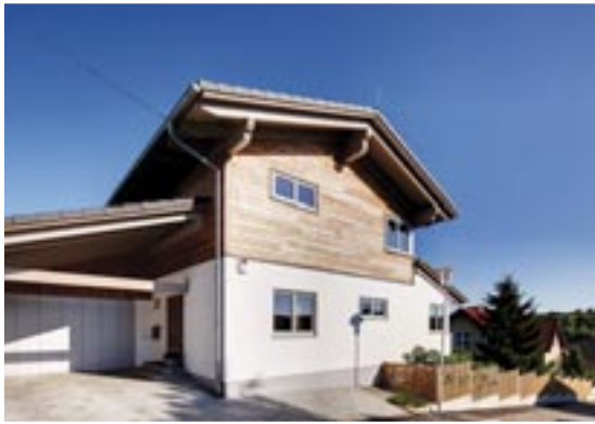
Typisch alpenländisch zeigt sich das Haus am Hang zur Straße.

unten weißer Putz, oben Holz. Obwohl das Haus über drei volle Ebenen verfügt – Keller, Erdgeschoss und Dachgeschoss –, ragt es nicht dominierend in die Höhe. Das liegt zum einen an dem flach geneigten Satteldach und zum anderen an den beidseitig niedrig angesetzten Dachausläufern über Küche und Carport. So schmiegt sich das „Dreidächerhaus“ organisch an den Hang. Die breiten Dachüberstände dienen zugleich als wirkungsvoller Sonnenschutz.